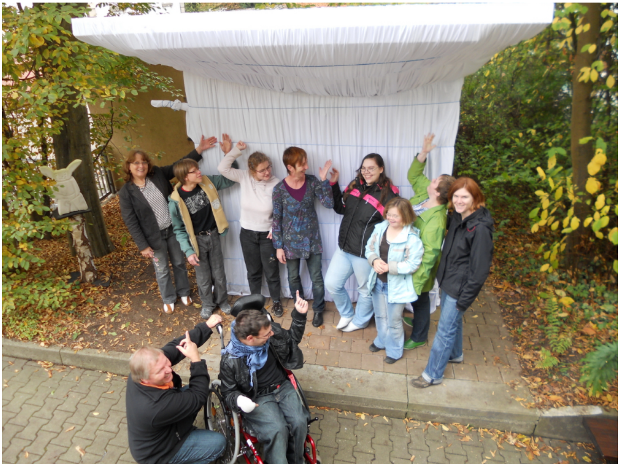
Unser verpacktes Brezelhaus