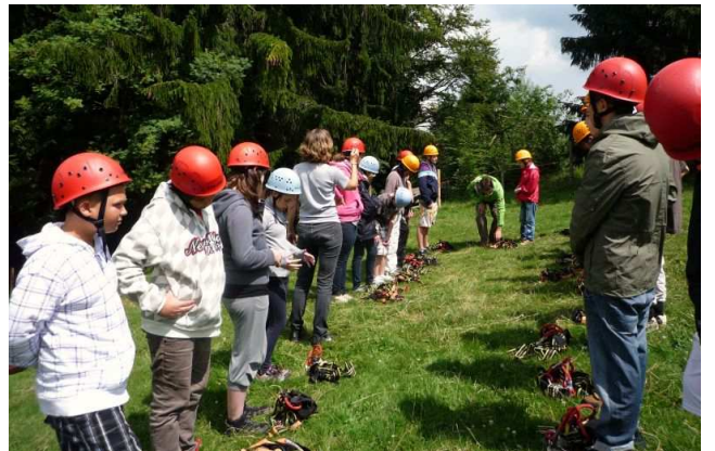
Sicherheitseinweisung beim Abseilen am Bachbett

Acht Tage verbrachten dort gemeinsam die SchülerInnen und LehrerInnen beider Schulen. Gefüllt war die Zeit mit Wandern, Bachbett klettern, Rafting, Alpsee coaster, Ausflügen, Spielen und noch vielem mehr.