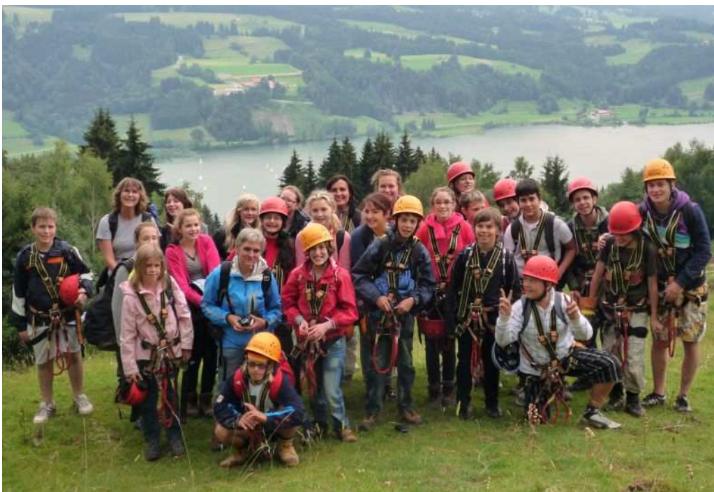
Vor der malerischen Kulisse des Alpsees