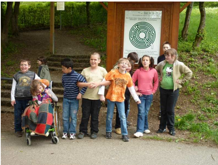
SchülerInnen der Klasse G1 und G5 in ihrem Schullandheim

Auch die Klasse H6 hat mit ihren LehrerInnen Frau Kügel und Frau Barth, sowie der betreuenden Kraft Frau Moll einige Tage im Schullandheim verbracht. Sie waren in Süßen im sogenannten „Bettnad“. Von dort aus wurden Ausflüge (z. B. nach Ulm zum Shopping; zum Stadtbummel nach Ulm und ins Kino) unternommen, sowie Dinge im und rund um das Haus durchgeführt.