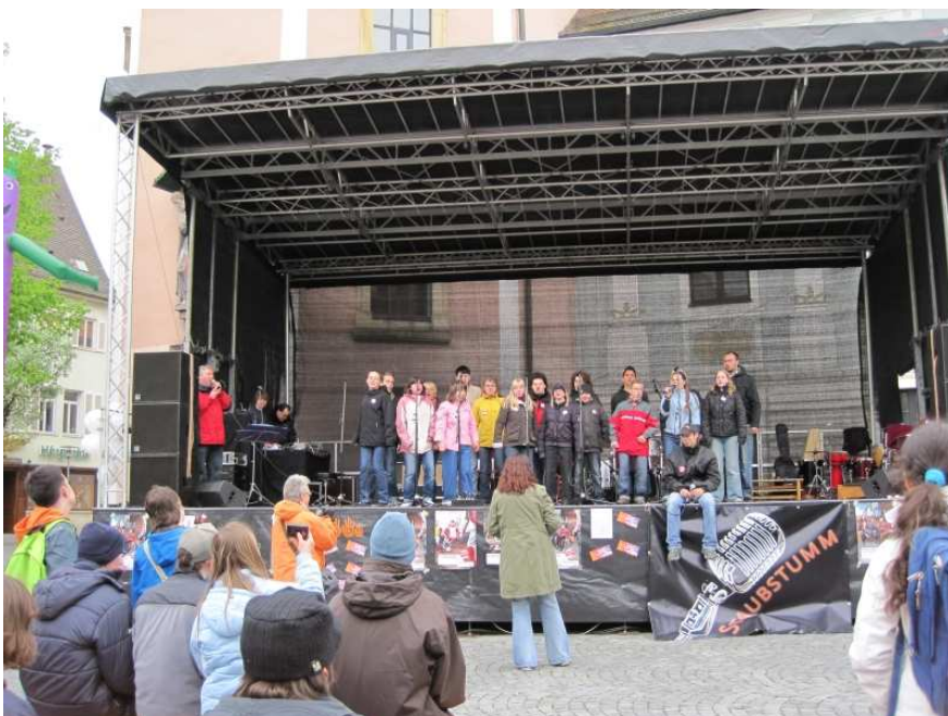
„Tiramisu“ bei ihrem Auftritt auf dem Johannisplatz

Am 05. Mai fand auf dem Johannisplatz in Schwäbisch Gmünd die Veranstaltung des Arbeitskreises „Aktion Netzwerk“ statt. An diesem Arbeitskreis ist die Klosterbergschule gemeinsam mit der Lebenshilfe und dem Lindenhof sowie weiteren Vertretern von Schulen, Einrichtungen, Beratungsstellen und Beiräten beteiligt. Ziel ist es, auf die Anliegen von Menschen mit Behinderung aufmerksam zu machen. In einem dreistündigen Programm mit Interviews und verschiedenen Aktionen, zeigten die Beteiligten, was ihnen am Herzen liegt. Zudem wurde gesungen und getanzt. Im Mittelpunkt stand die im März 2009 in Kraft getretene UN-Konvention über die Rechte behinderter Menschen. Von der Klosterbergschule waren „Tiramisu“ und die „Klopfspechte“ am Programm beteiligt. Des weiteren wurde der Kuchenverkauf von uns organisiert.