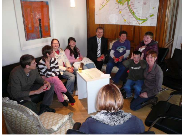
die Klassen B1 und B3 beim OB