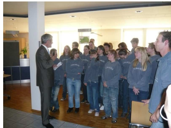
Der Schulchor „Tiramisu“ mit Herrn Landrat Klaus Pavel

Am 22. April 2010 fand im Gebäude des Landratsamtes auf dem Hardt die Eröffnung der Schulkunst-Ausstellung des Ostalbkreises statt. In einer kleinen Feierstunde wurde in das Thema „Begegnung mit Farben“ eingeführt.