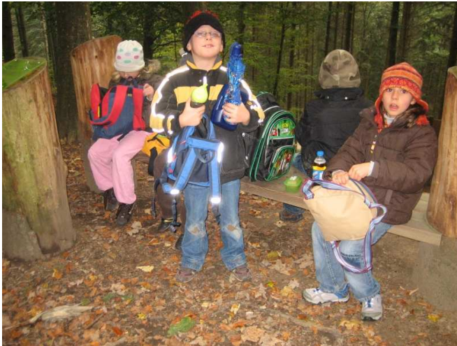
Die SchülerInnen bei der Frühstückspause im Wald