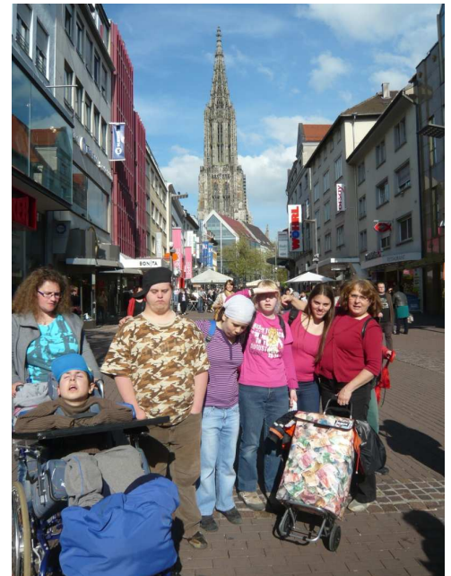
Die Klasse H6 vor dem Ulmer Münster

Auf unserer Homepage www.klosterbergschule.de finden Sie den Info-Brief in Farbe!