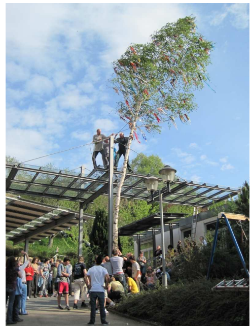
SchülerInnen, Zivis, Hausmeister und viele mehr waren nötig, um den Baum gemeinsam aufzustellen