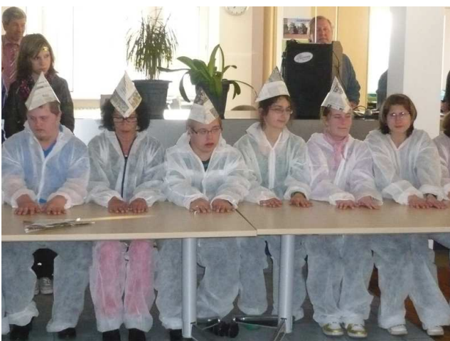
Die Theatergruppe „EigenSinn“