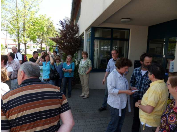
vor dem Haupteingang in Schorndorf