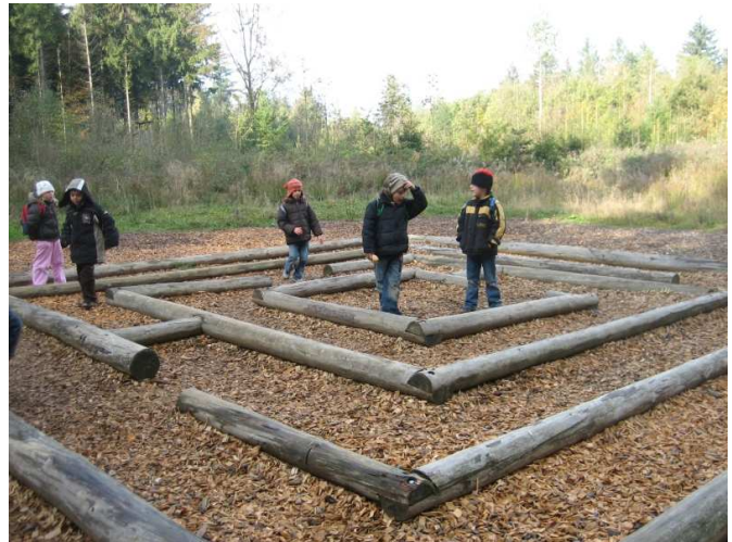
Die SchülerInnen beim Erkunden des „Labyrinth“